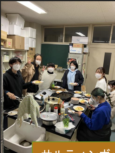
サルティンボッカとパスタ

先生と学生みんなで協力して作って食べました。 身近な料理からあまり食べる機会がない料理まで様々なレパートリーがあります。