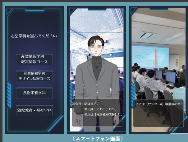
(スマートフォン画面)