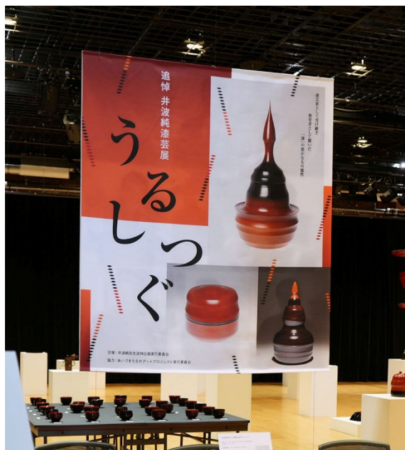
図5 会場入口に設置したバナー