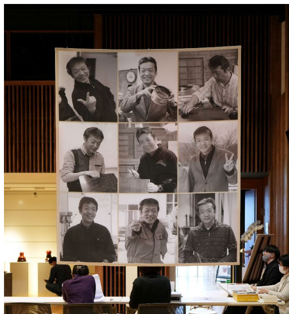
図6 卒業生の作品の前に設置したバナー