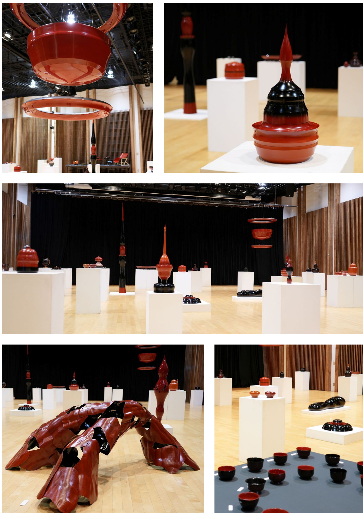
図4 追悼展の会場風景