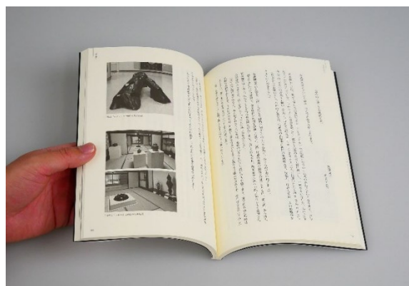
図9 追悼集（追悼文ページ）