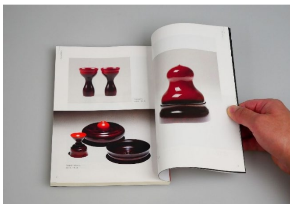
図8 追悼集（作品図版ページ）