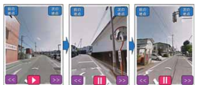
図5:自動再生時の画面遷移

なお、ストリートビューの表示地点が、観光スポットや利用者の選択したジャンルに適した店舗の場合には、その地点の説明文を AR 11 的に重畳表示させるようにした。図6の画面表示例では、ストリートビューの表示地点が前述した条件に適さない場合、補助情報は表示され