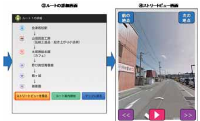
図4:本アプリの画面遷移2

このルート途中の景色を見る機能の処理では、ルート推薦機能で作成した経路の座標を取得し、その座標に沿って順次ストリートビューを表示させている。