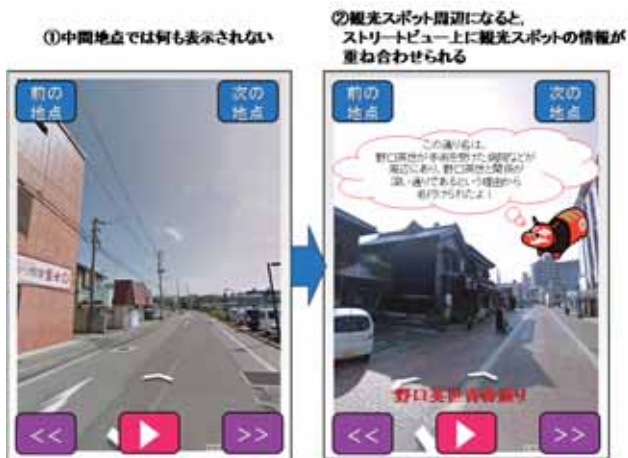
図6: ストリートビュー上に観光スポットについての情報を重ね合わせた際の画面イメージ

ないが(図6①), 観光スポットである野口英世青春通りである場合, その地点の説明文と赤べこが重畳表示される(図6②). この機能によって, 1つの画面で, 観光スポットの情報や観光スポットの外観, 周辺スポットの景観をすべて確認することができる。