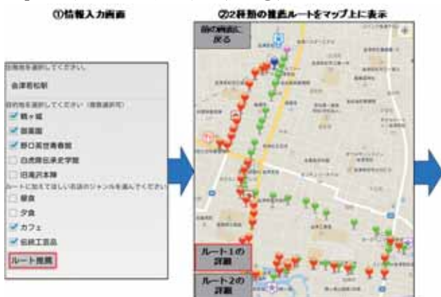
図3:本アプリの画面遷移1

次に利用者は、推薦された複数のルートの選択の判断材料を得るために、「ルート1の詳細」か「ルート2の詳細」のいずれかをタップする(図3②)。