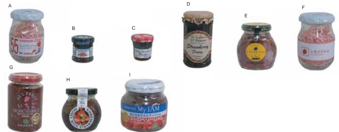
何の種類がすぐ分かるジャムはどれですか？