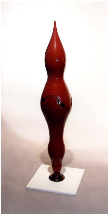
Core W30cm×D30cm×H120cm 漆・麻布・金箔 7kg