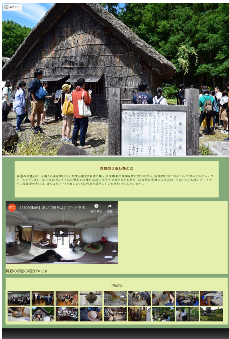
図6 パソコンで閲覧した際のイメージ