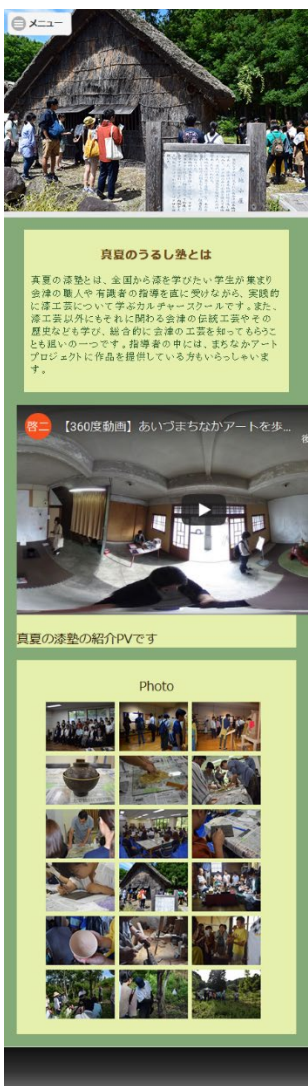
図5 携帯で閲覧した際のイメージ

また、真夏の漆塾のページでは元来の漆が持っていた赤と黒のイメージを一新すべく、原材料である漆の木の柔らかな緑を基調とした配色を施した。加えて、フォトギャラリーやパノラマ写真もページに取り入れた。