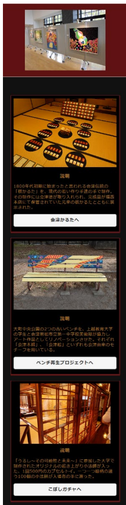
図4 各イベントページ