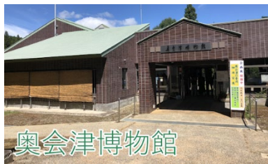
図 8 動画内のキャプチャ