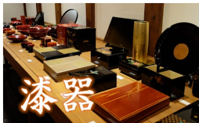
図 9 漆器の紹介

真夏の漆塾二日目に訪れた奥会津博物館で、一本の丸太からいくつものお椀が作られる様子を撮影し、制作した。丸太を削りお椀の形になっていく一連の作業を簡単かつ分かりやすいようにまとめた。