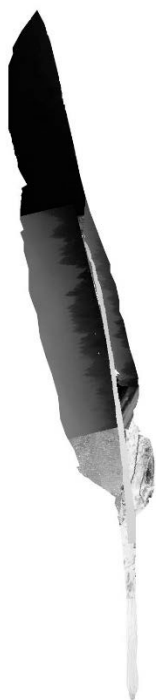
カワウ (神指・鶴ヶ城・東山)