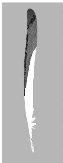
ハクセキレイ (市内全域)