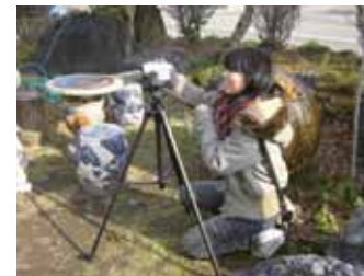
取材5 会津若松市（赤べこ絵付け体験）

昭和村では、田舎暮らし体験宿泊施設に実際に宿泊し、農作業の体験をさせていただきながら、取材してきた。