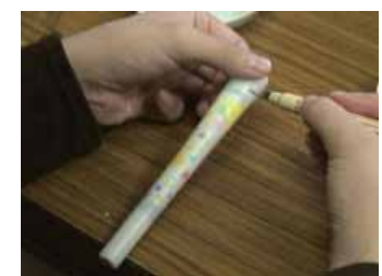
取材6 会津若松市（絳ろうそく絵付け体験）