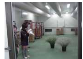
取材4 昭和村 （昭和村滞在施設体験・農林水産集出荷貯蔵施設）