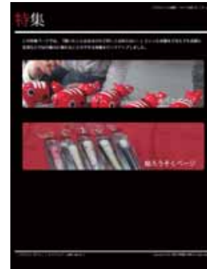
図4 制作したwebページ（特集ページ）

『聞いたことはあるけれど詳しくは知らない…』といった会津のモノをどなたでも気軽にその魅力に触れることのできる体験をピックアップし、特集ページとして制作した。