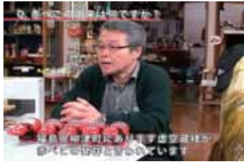
図1 完成した動画の1シーン（会津若松市）

ハンディカメラを使用して撮影し、Adobe Premiere Pro CS3を使用して編集した。