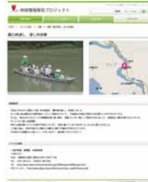
図3 制作したwebページ

地図、ジャンル別、地域別に表示されるようになっている。動画や情報を地域と一致させるためにマップを組み込み表示した。動画説明の下にはアクセス情報を記載し、このページを見て興味を持った方がより詳細な情報を得られるようにしてある。