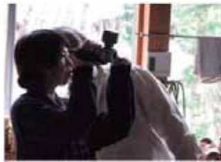
図2 撮影風景（三島町）

取材は事前に考えたものや、体験してみても素朴な疑問などを質問している。動画にはテロップをつけ視聴者にとって見やすくなるよう心がけている。