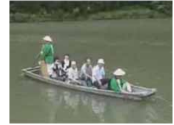
取材2 三更地区（渡し舟）

地元産の会津桐のみを使用し、職人さんが一棹一丁寧に作り上げた桐箆筒と職人さんを取材した。