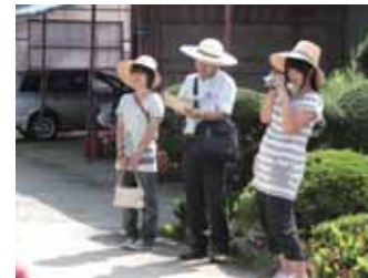
取材3 高郷村（留学生農業体験・そば打ち体験）