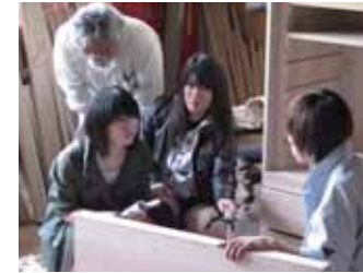
取材1 三島町（桐ダンス）