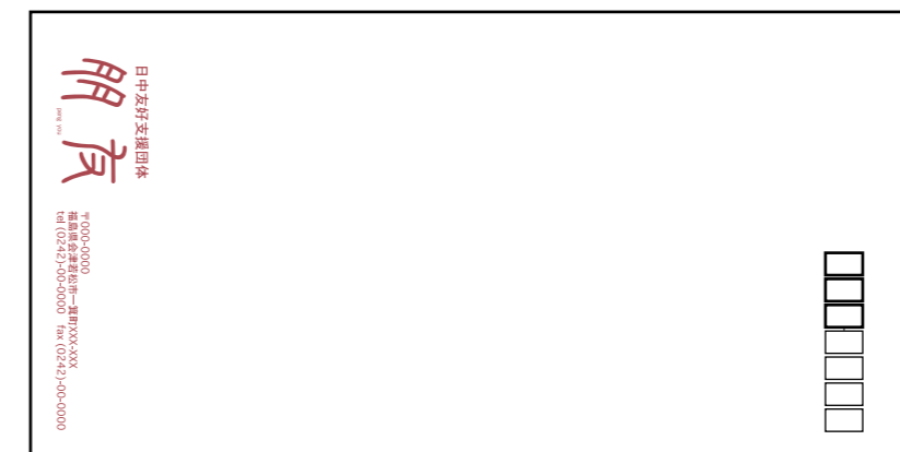
封筒デザイン案 (長型3号)